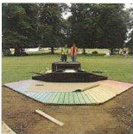
Andre dag, gangvei og første blomsterbed på plass.