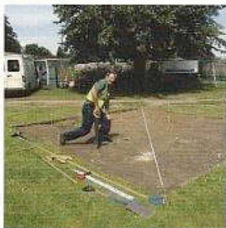
Første dag på Hampton Court. Jorden jernes og gjerdes kler til oppbygging.