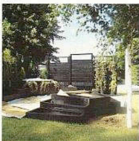
Klatrplantene løsnes og festet til treveggene. Dette arbeidet tok to personer to dager!